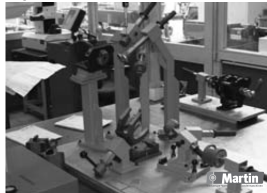
Biege- und Kontrolllehren für Rohre